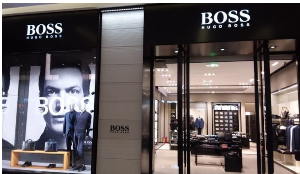
Hugo Boss reduz lucro de 13% em 2019

A empresa têxtil alemã Hugo Boss apresentou um lucro líquido atribuível de 205 milhões de euros em 2019, o que representa um declínio de 13% em relação ao resultado do ano anterior, confirmou a Boss, antecipando um impacto significativo do COVID-19 nas vendas e lucros de 2020.