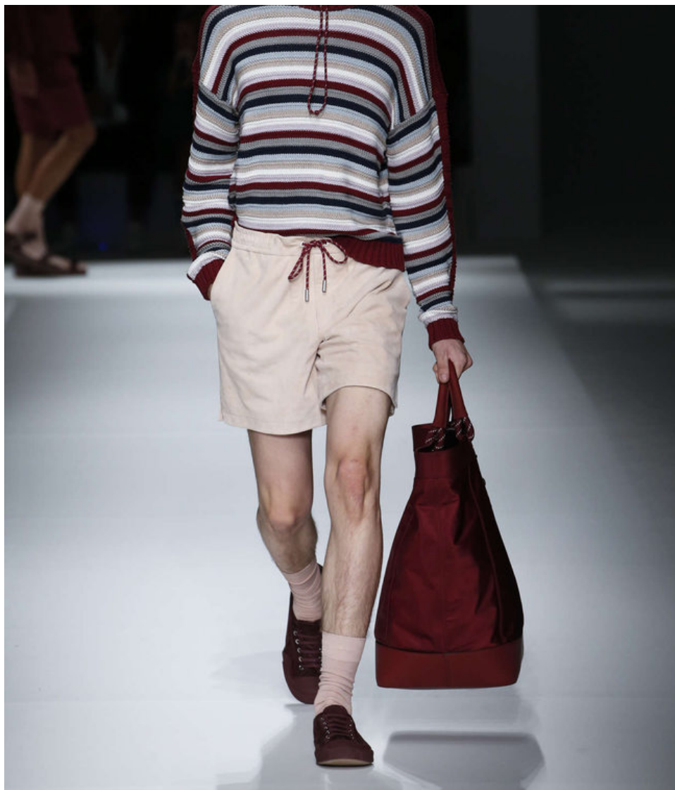
Hugo Boss queixa-se do COVID-19 afectar os negócios na Ásia

"A empresa também está a sofrer uma queda significativa nas vendas noutros mercados-chave", diz o CEO.